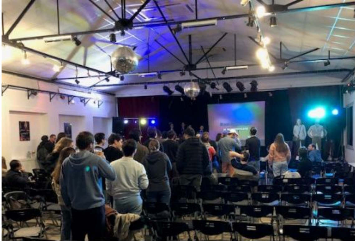
Karoké (JC2 2025)