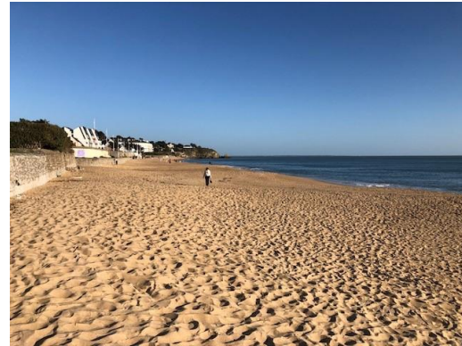
Pornichet, JC2 2025