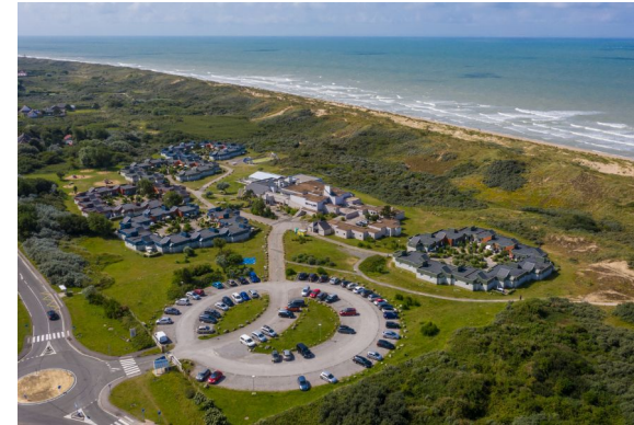
Calais, JC2 2026