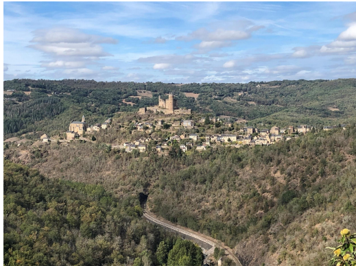
Najac, JC2 2023